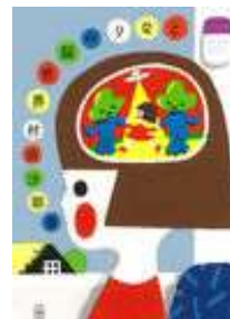
『となりの脳世界』 村田 沙耶香 リコリス所蔵