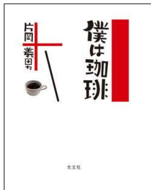
『僕は珈琲』 片岡義男 ハートフル所蔵

読み進めるにつれ、なぜかノスタルジックな気分になるエッセイです。映画化されている作品も多い片岡義男さんなので、昭和な時代が楽しめます。珈琲にまつわるエッセイはご自身が撮った洒落た写真と一緒に味わう事ができます。香り良い深入りの珈琲はいかがですか？