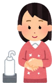
【入館の際の手指の消毒】