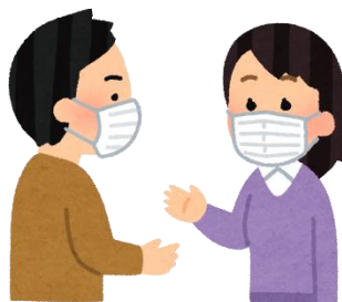
【館内での会話は控える、又は会話の時はマスクを着用】